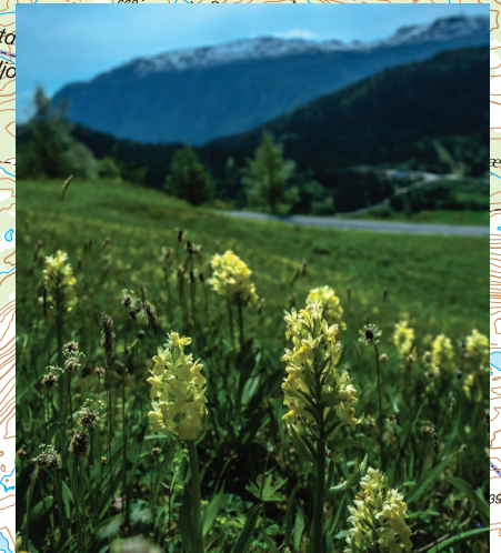
Fylkesblomsten - Søstermarihånd